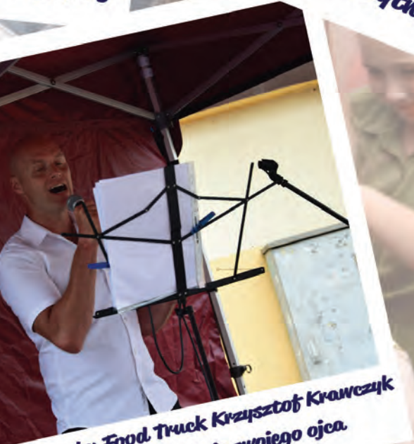
Przystanku Food Truck Krzysztof Krawczyk junior śpiewał przeboje swojego ojca.