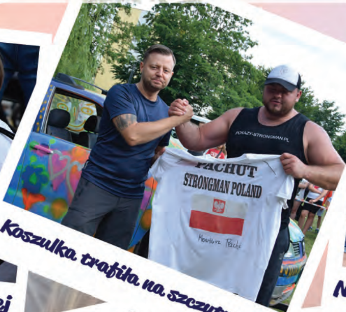
Koszulka trafiła na szczytny cel