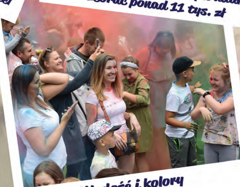
Młodość i kolory na Placu 3 Maja