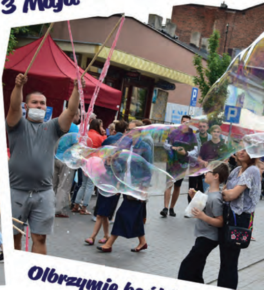
Olbrzymie bańki także na ul. Reymonta