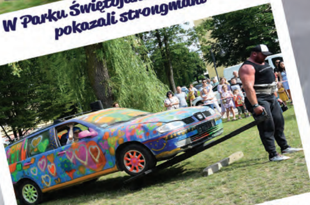
Dla siłaczy auto to pestka, nawet z pasażerkami