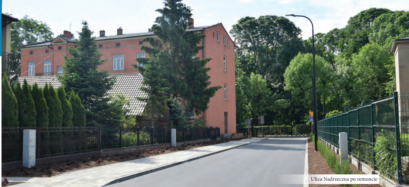
Ulica Nadrzeczna po remoncie