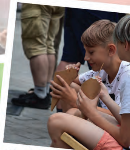
Na leżakach smakuje na