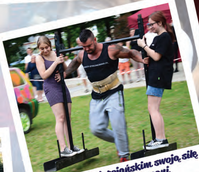
W Parku Świętojańskim swoją siłę pokazali strongmani