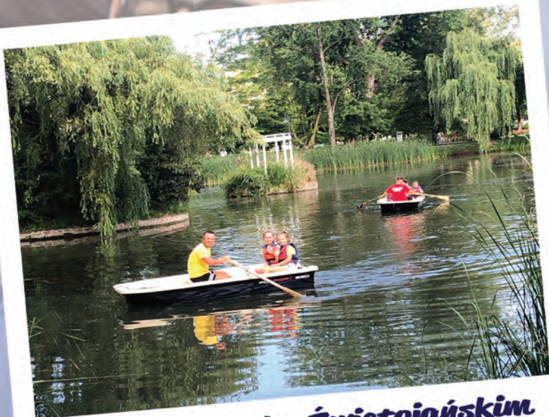
Łódki w Parku Świętojańskim