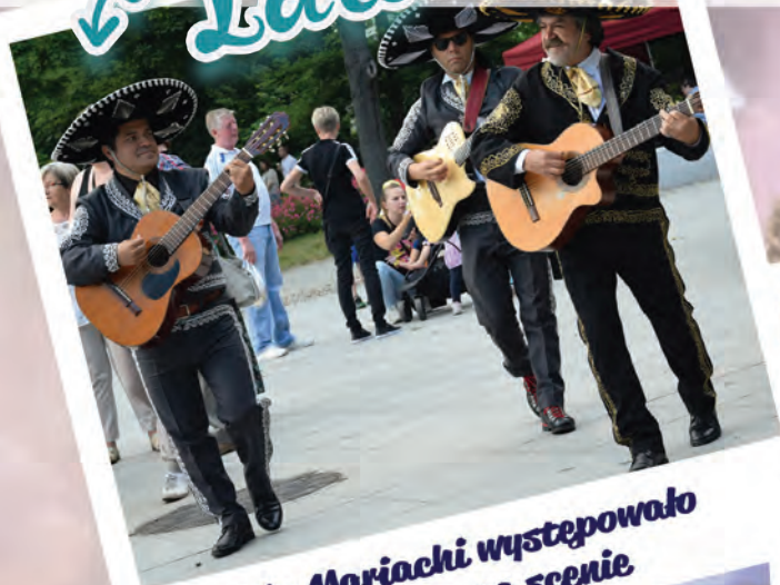
Trio Mariachi występowało nie tylko na scenie