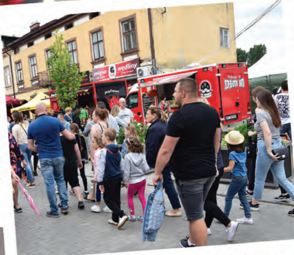
Tłumy radomszczan na deptaku