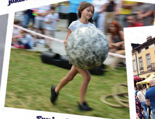
Swoją siłę pokazali również najmłodszy