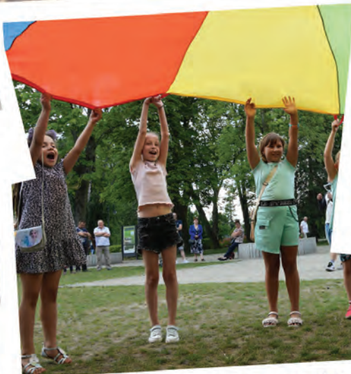
Konkursy i zabawy przyciągnęły mnóstwo dzieciaków